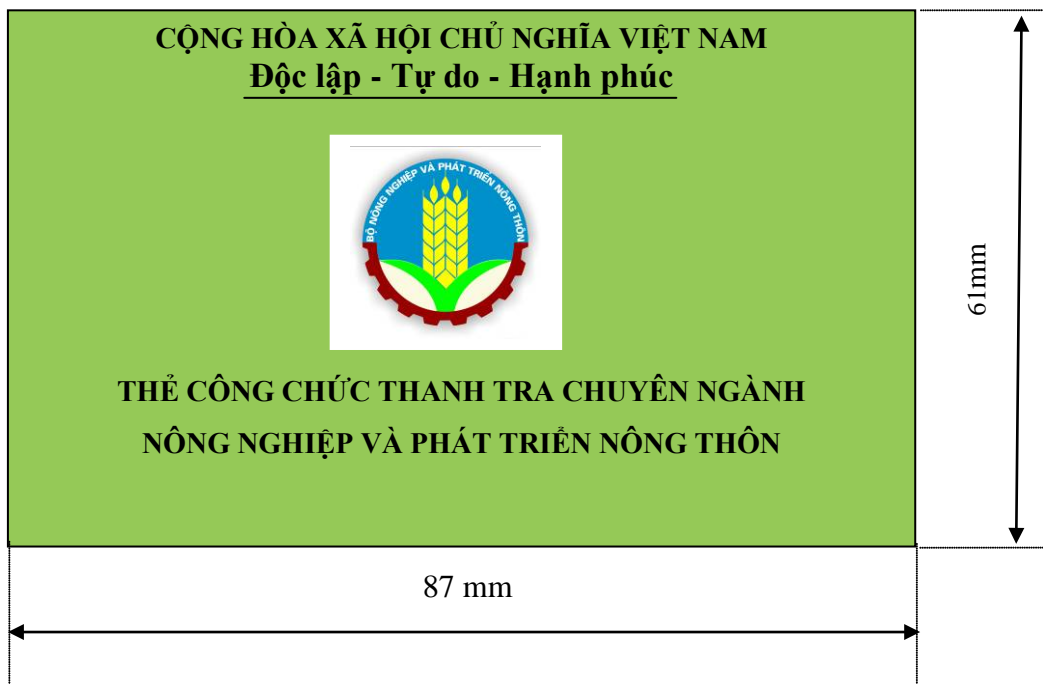
Hình 2: Mặt sau thẻ công chức thanh tra chuyên ngành